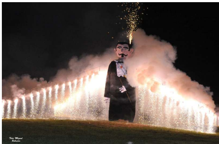
FOTO 1 . A QUEIMA DO MECO. RIBADEO.

O Entroido no ámbito lucense mantén o seu enraizamento debido a que as súas expresións ritualísticas seguen transmitíndose por tradición oral de país a mozos, facendo posible que esta festividade siga conservándose na actualidade. Constitue unha expresión colectiva de identidade das diferentes comunidades nas que aínda se conmemora. Este evento profano adquire un gran significado nalgúns lugares ata o punto de acadar máis relevancia que calquera outro evento relixioso. No obstante, hoxe á precariedade demográfica existente en moitas comunidades motiva que algúns membros das mesmas estén dando a coñecer a súa tradición entroidana de primeira man e, polo tanto, dun xeito obxectivo nos Centros de Ensino primario e secundario. Ademais, cómpre que as diferentes Asociacións culturais das parroquias leven a cabo nos seus centros de reunión “talleres” de aprendizaxe dos diferentes rituais entroidanos mais sempre axeitados a diferentes niveis de idade.