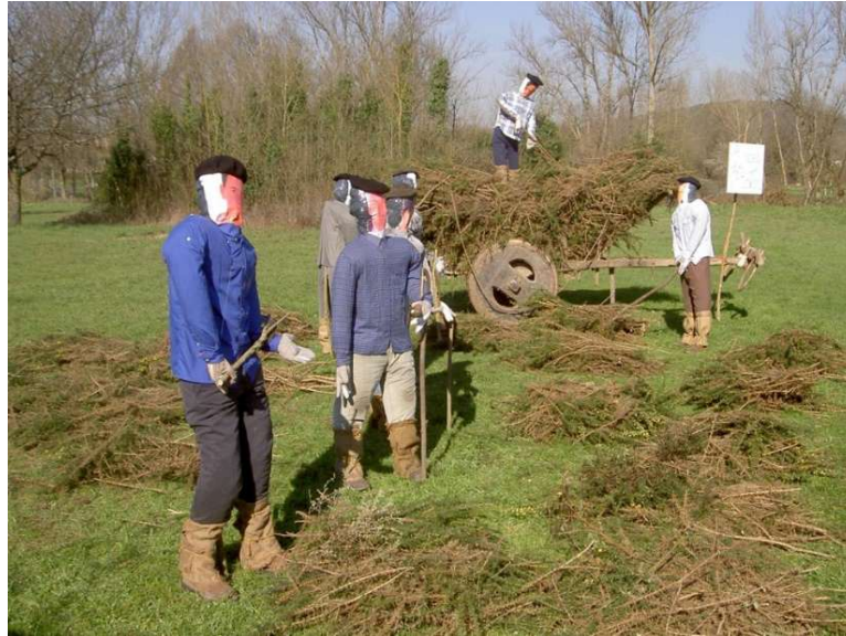
FOTO 12. XOVES DE COMPADRES. A ROXA DOS TOXOS. DISTRIZ (MONFORTE DE LEMOS)