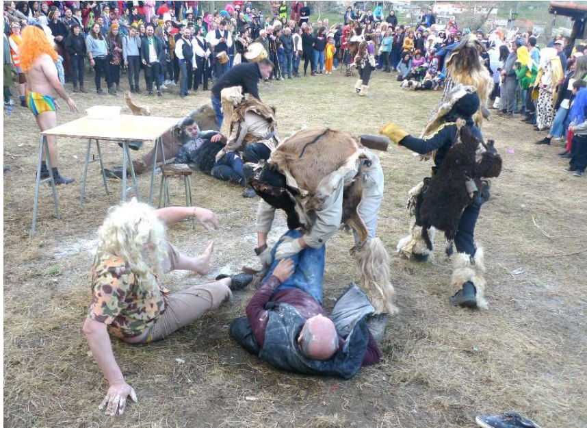
FOTO 17. A RUPTURA DUN OFICIO (SANTIAGO DE ARRIBA). “PON A CARA, CARALLO, PON”.