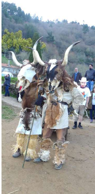
FOTO 14. A MASCARADA DOS MARAGATOS OU PELIQUEIROS (SANTIAGO DE ARRIBA)

protexer ás persoas, que acudían a ver “ a corrida do galo” dos xinetes, que participaban na mesma. Hoxe, a súa finalidade é protexer ao Entroido, non permitindo que as persoas se acheguen moito a él; e, tamén, cando vai a ser queimado están atentos de que ningunha persoa se acerque a fogueira. A caraúta dos fareleiros, amosa moitas veces un carácter animal, representando a un mono; tamén, a un oso, como ocorreu no ano 2025.