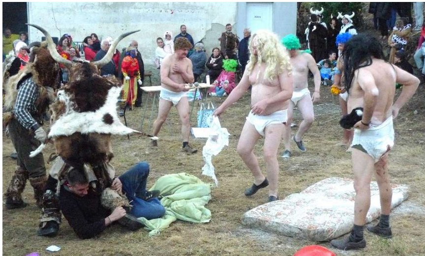
FOTO 16. A RUPTURA DUN OFICIO (SANTIAGO DE ARRIBA). (CHANTADA) “A GUARDERÍA DO MOREDO”.

Os oficios adoitan ter un gran éxito entre o público da bisbarra, de concellos limítrofes e mesmo da cidade de Lugo, De ano en ano o nivel de afluencia, se o tempo acompaña, vai aumentando considerablemente.