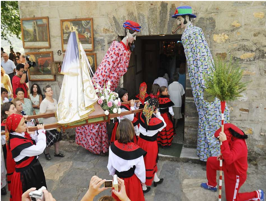
FOTO 5. O MECO E AS PAMPÓNIGAS FACENDO UNHA REVERENCIA AO PASO DA VIRXE DOS REMEDIOS (A ERMIDA)(QUIROGA)