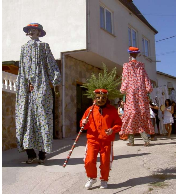
FOTO 4. O MECO VAI ACOMPANADO DAS PAMPÓNIGAS NA PROCESIÓ DOS REMEDIOS (A ERMIDA) (QUIROGA).