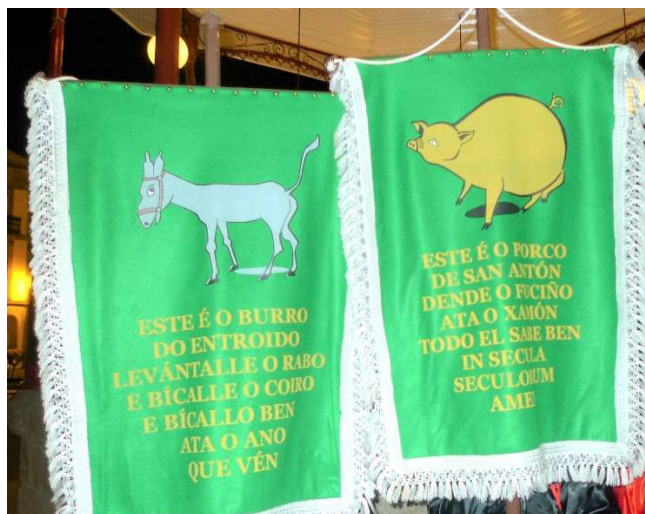
FOTO 20. ESTANDARTES DO BURRO E O PORCO. ENTERRO DA SARDIÑA (LUGO)