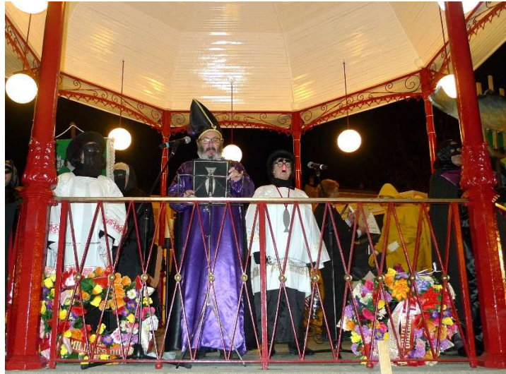
FOTO 2. ENTERRO DA SARDIÑA (LUGO). O GRAN ESPETÓN RECITA OS FERRETES.