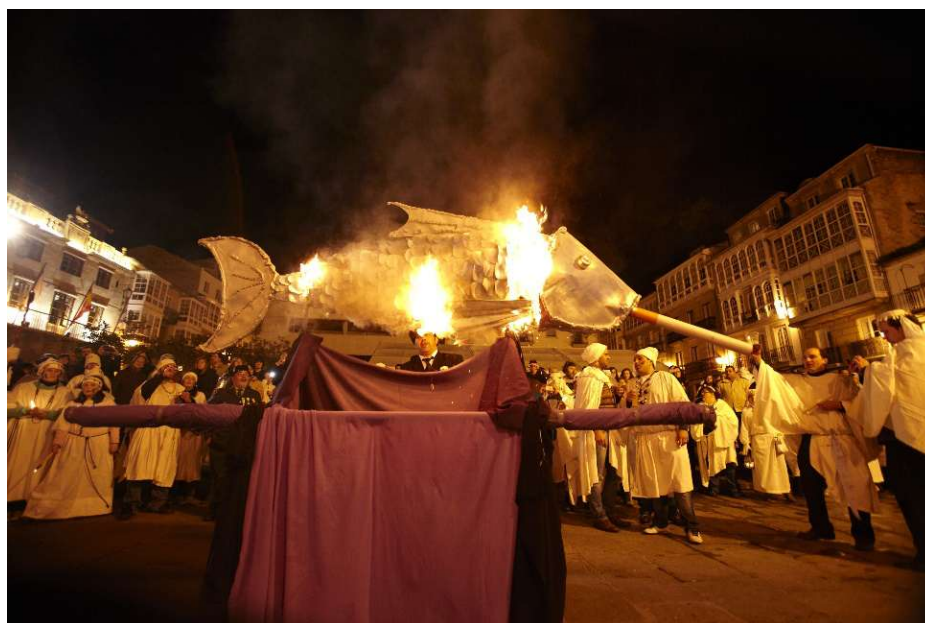
FOTO 7. QUEIMA DA SARDIÑA EN VIVEIRO