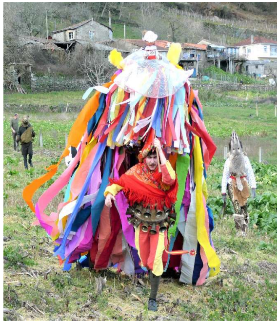
FOTO 3. O “PUCHO” É A PARTE SUPERIOR QUE LEVA “A MÁSCARA DO VOLANTE”.

4º. Se o Irrio se excedese nas súas atribucións só o rexedor do concello será a única autoridade competente para impoñerlle a sanción correspondente.