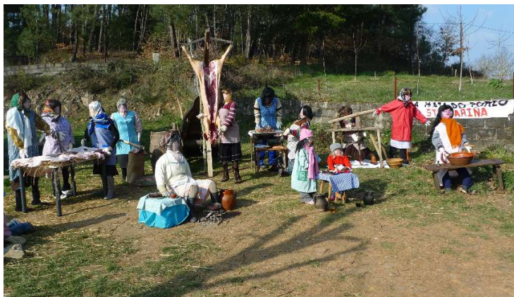
FOTO 9. XOVES DECOMADRES. A MATANZA DO PORCO. SANTA MARIÑA (MONFORTE DE LEMOS)