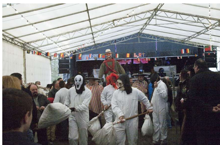
FOTO 11. A MASCARADA DOS FARELEIROS (VAL DE FRANCO) (CASTRO DE REI)